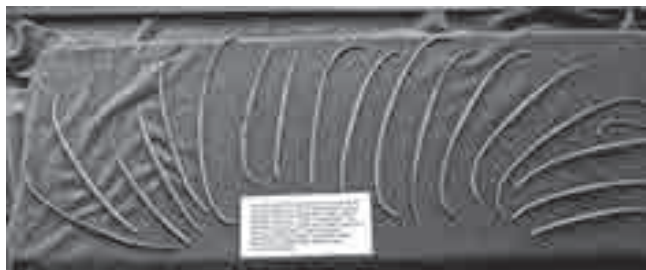
Měděná žebra v Milevském muzeu.